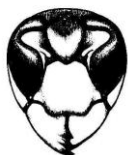
Hornisse ( Vespa crabro )